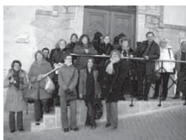
Teams beim Projekttreffen in l'Alcora/Spanien

Projektnummer: 2009-1-DE2-GRU06-01780 2 Laufzeit: August 2009 – Juli 2011