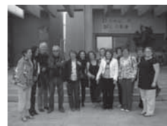
Bildungsexperten – Treffen in Huelva

Im Rahmen eines Studienbesuchs für Bildungsexperten in Huelva/Spanien sind der andalusische Förderplan für bilingualen Unterricht und einige Beispiele seiner Realisierung Experten aus verschiedenen EU-Ländern vorgestellt worden.